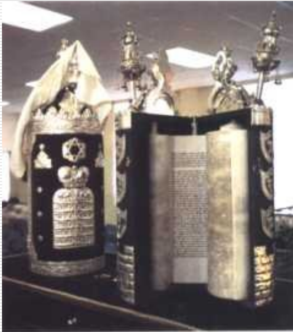
свитки Торы в футлярах (по обычаю сефардских общин)